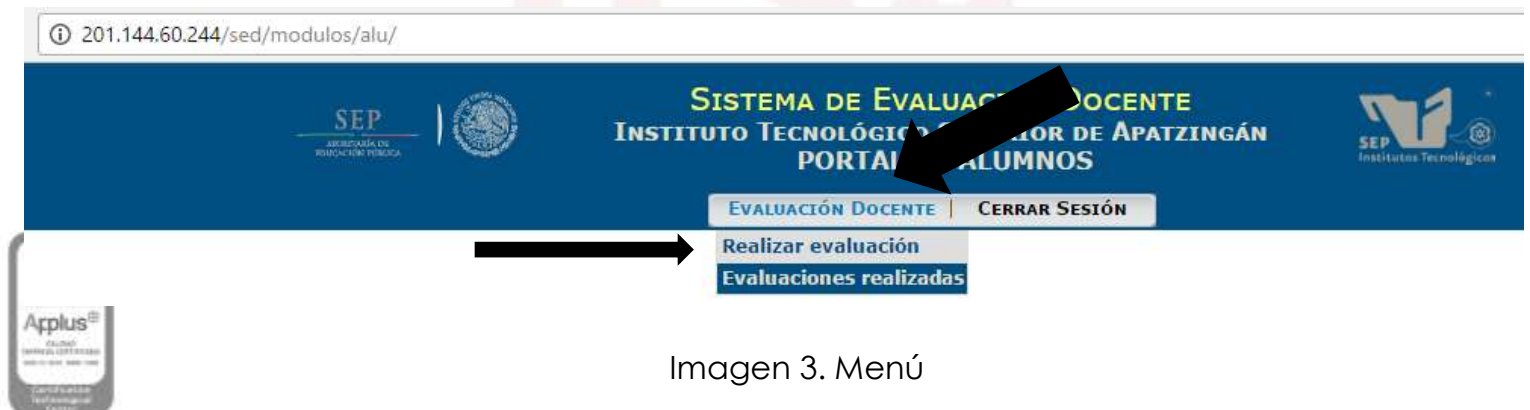
Imagen 3. Menú