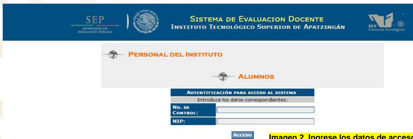
Imagen 2. Ingrese los datos de acceso