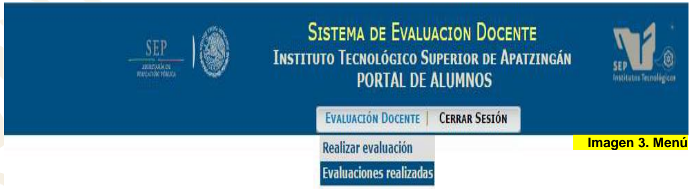
Imagen 3. Menú